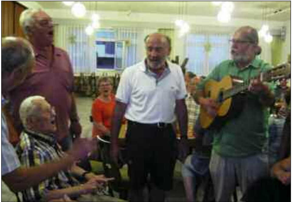
Herbstfest beim Vereinigten Chor Rintheim am 31.10.2015