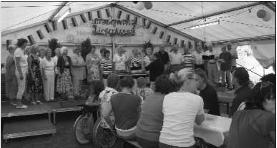
Stammchor am 27.06.2010 beim GSV Wolfartsweier.